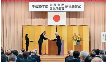
三田共用会議所で開催された納税表彰式