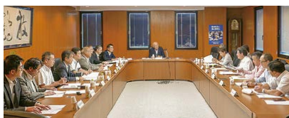
地球温暖化報告書制度の推進などについて審議する公益事業委員会

租税教育活動については、本年度も「税を考える週間」にキッザニア東京において税のブースを設置し、子供たち