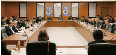
税制改正提言の報告を受ける理事会

提言については10月に開催された法人会全国大会(鳥取大会)において報告された(一面記事参照)。また、提言に基づくスローガン4本も全法連理事会で承認さ